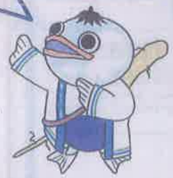
安田町イメージキャラクター 安田朗

安田町は、日本遺産認定ストーリー「森林鉄道から日本一のゆずロードへーゆずが香り彩る南国土佐・中芸地域の景観と食文化ー」の所在自治体やきね!