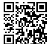
申込フォーム QRコード

フォームで申し込む際は、「通信欄」に参加する内容を記載してください。 ピッピネットからもフォームで申し込みができます。