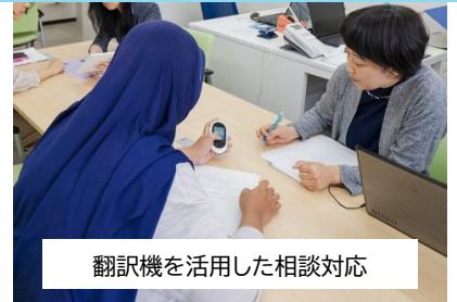
翻訳機を活用した相談対応