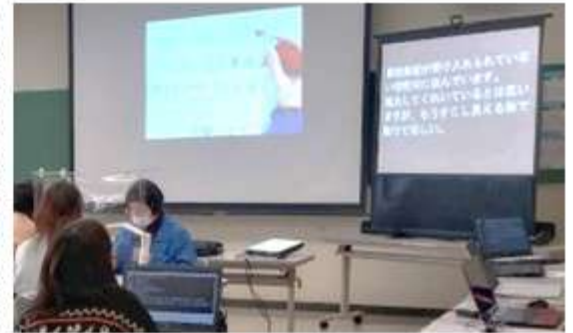
令和4年度 要約筆記者養成講座 総合実習の様子

◆接客業をしており、聴覚障害者や高齢で耳が聞こえにくい方に、どうしたら早く正確に伝えられるのか悩んだ経験があったことから、要約筆記の技術を身につけることで役立てるのでは、との思いがありました。要約筆記の技術を身につけるのは想像以上にハードですがやりがいも感じています。