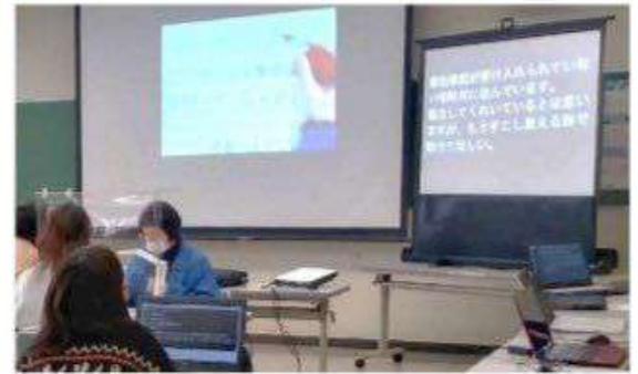
要約筆記者養成講座の様子