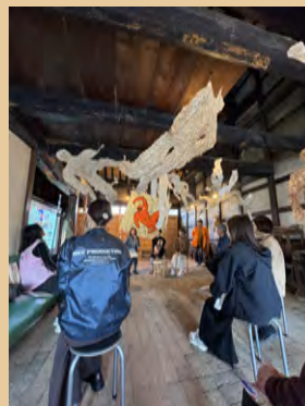
トークやワークショップも開催されました