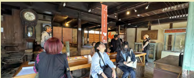
天井に隠れた秘密を考えてみんなで上を見上げています

みているだけではわからない建物に隠れた歴史がわかって面白い！瓦の仕組みを初めて知ったなど嬉しい感想をいただきました。また今後も、折に触れて建築案内ツアーは開催していきたいと思いますので、今回見逃した！という方は、ぜひまたの機会にご参加ください。地域の建物を、身近で面白いものにできるよう、これからも様々な機会でご語り伝えていきたいです。