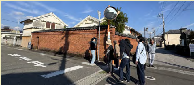
煉瓦塀は南面と西面で高さが異なるのはなぜでしょう？